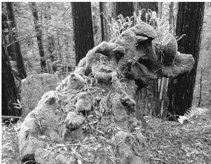
El perro de Jim.

Alpes franceses, pollitos y patas bush en Moldavia, moscas tse-tsé y conejillos de indias en un laboratorio de Zimbabue de una novela para jóvenes, gatos ferales, ballenas que llevan cámaras, delincuentes y perros en adiestramiento en la prisión, y un talentoso perro con una mujer de mediana edad practicando deporte juntos en California. Todas estas son figuras, y todas están mundanamente aquí, en esta tierra, ahora, preguntándose en qué «nosotros» se convertirán cuando las especies se encuentren.